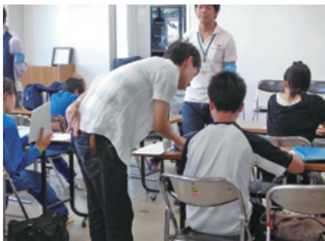
生涯学習会館での学習の様子

今年度は、中学生を対象として土曜日は生涯学習会館で、日曜日はLVMH子どもアート・メゾンで開催しており、多数の中学生たちが参加しています。