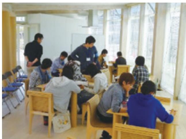
LVMH子どもアート・メゾンでの学習の様子